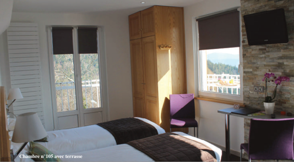
Chambre n°105 avec terrasse