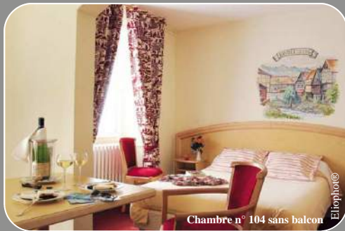
Chambre n° 104 sans balcon

Une décoration et un confort traditionnel