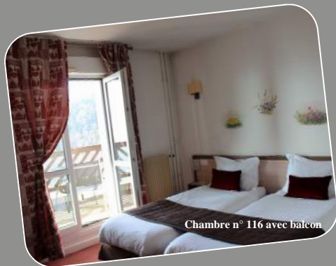
Chambre n° 116 avec balcon