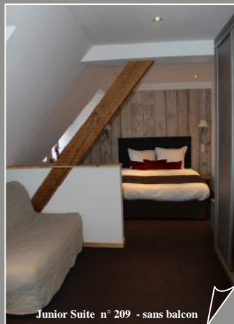
Junior Suite n° 209 - sans balcon

L'alliance d'une décoration chaleureuse et d'un confort actuel