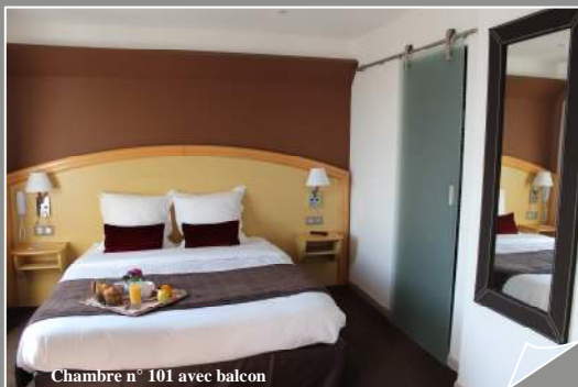
Chambre n° 101 avec balcon